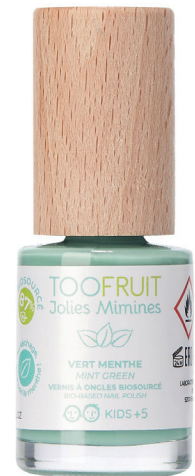
FLASCHE 10 ML ARTIKELNUMMER: PF130